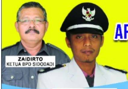
ZAIDIRTO KETUA BPD SIDODADI